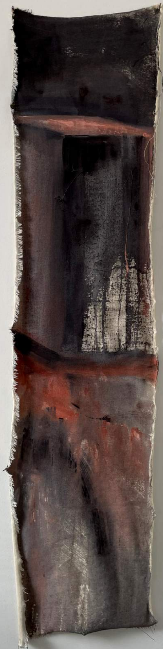
Monika Szczygieł, Catun / A shroud , akryl / acrylic, 2022