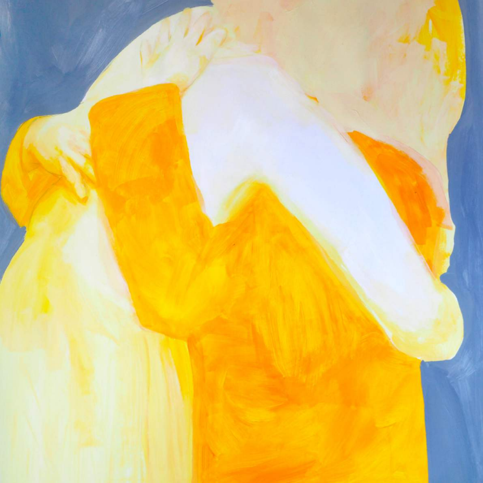
Monika Szczygieł, Antysystemowa czułość / Anti-system sensitivity , akryl / acrylic, 2022