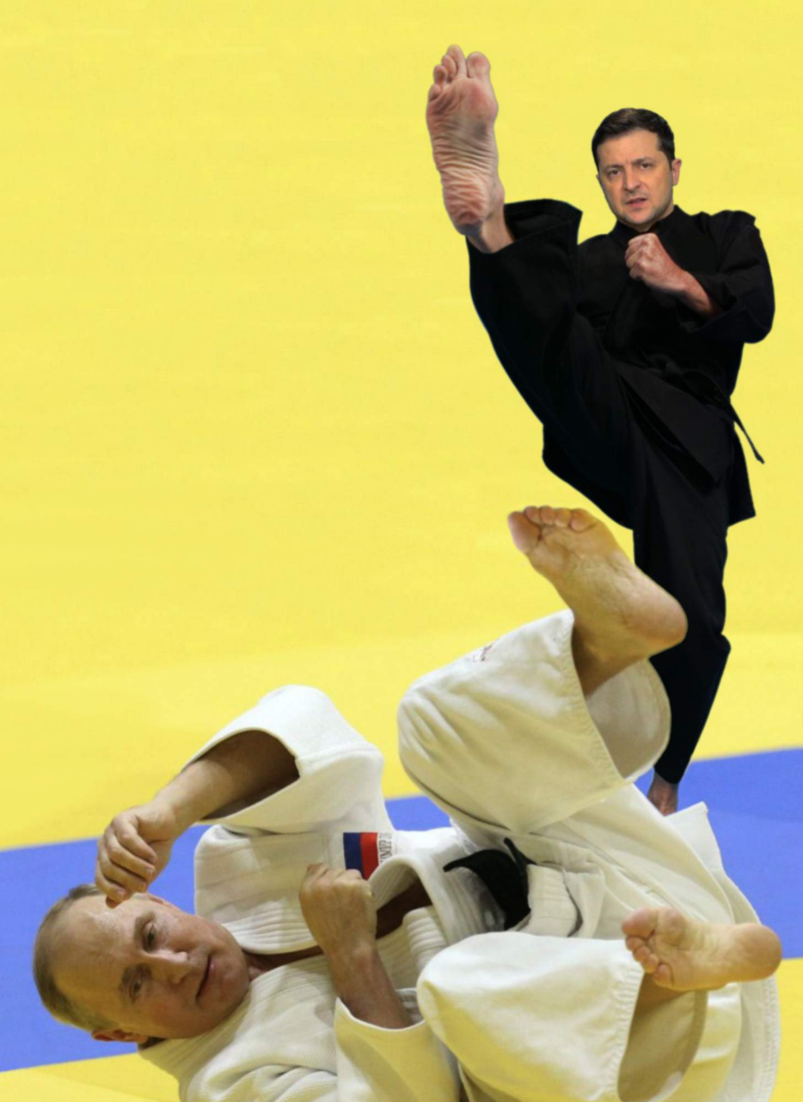
Janusz Marciniak, Dawid i Goliat / David and Goliath , fotomontaż / photomontage, 2022