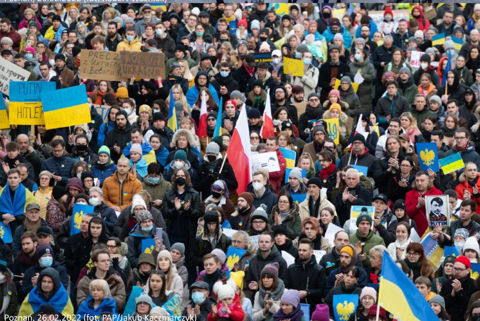
Poznań, 26.02.2022