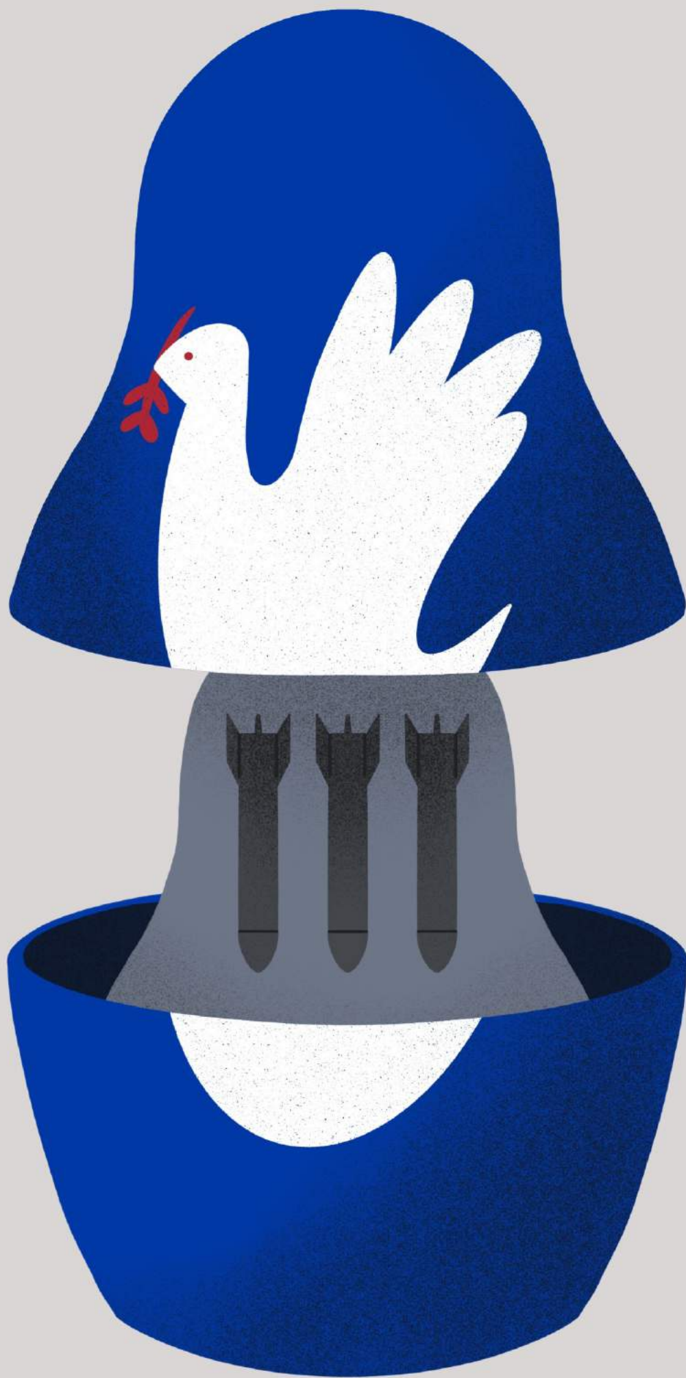
Monika Bartosiak, Matrioszka / Matryoshka , plakat / poster, 2022