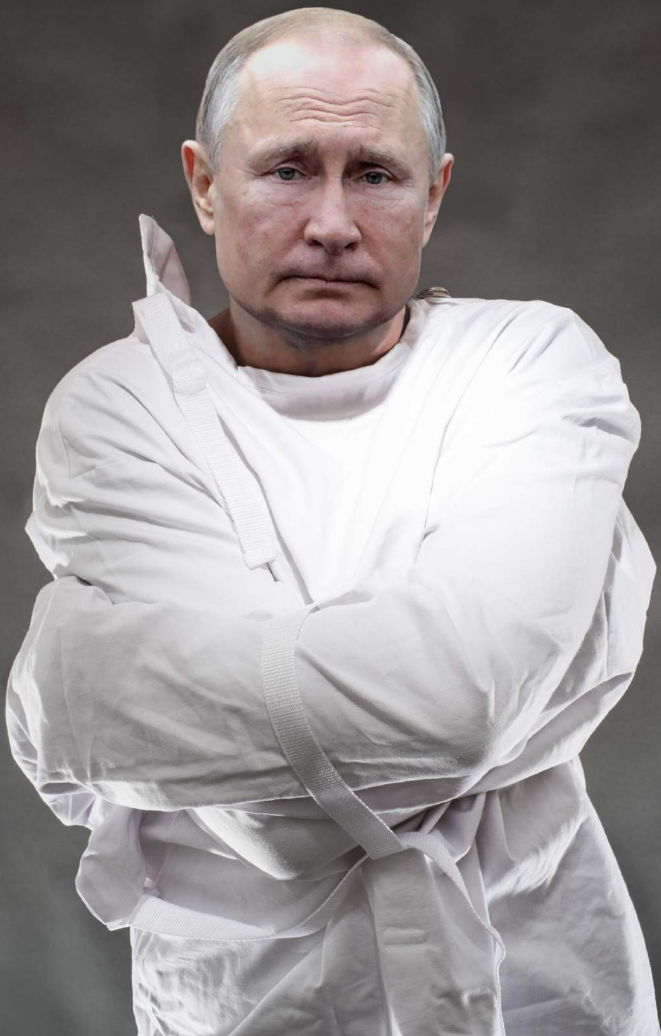
Janusz Marciniak, List do Putina / Letter to Putin , broszura / booklet, 2022