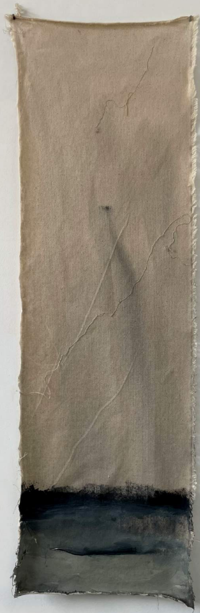
Monika Szczygieł, Catun / A shroud , akryl / acrylic, 2022