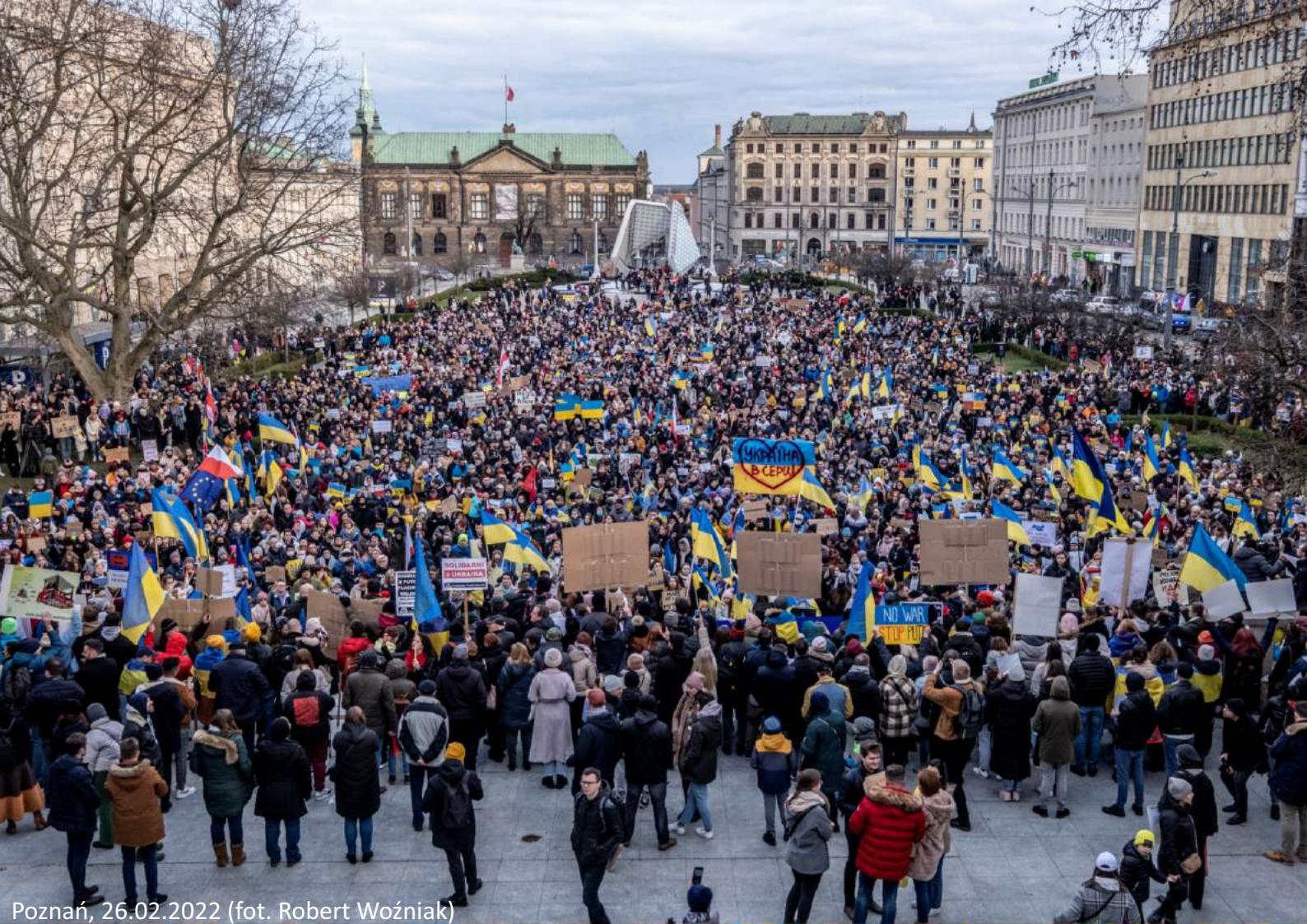
Poznań, 26.02.2022