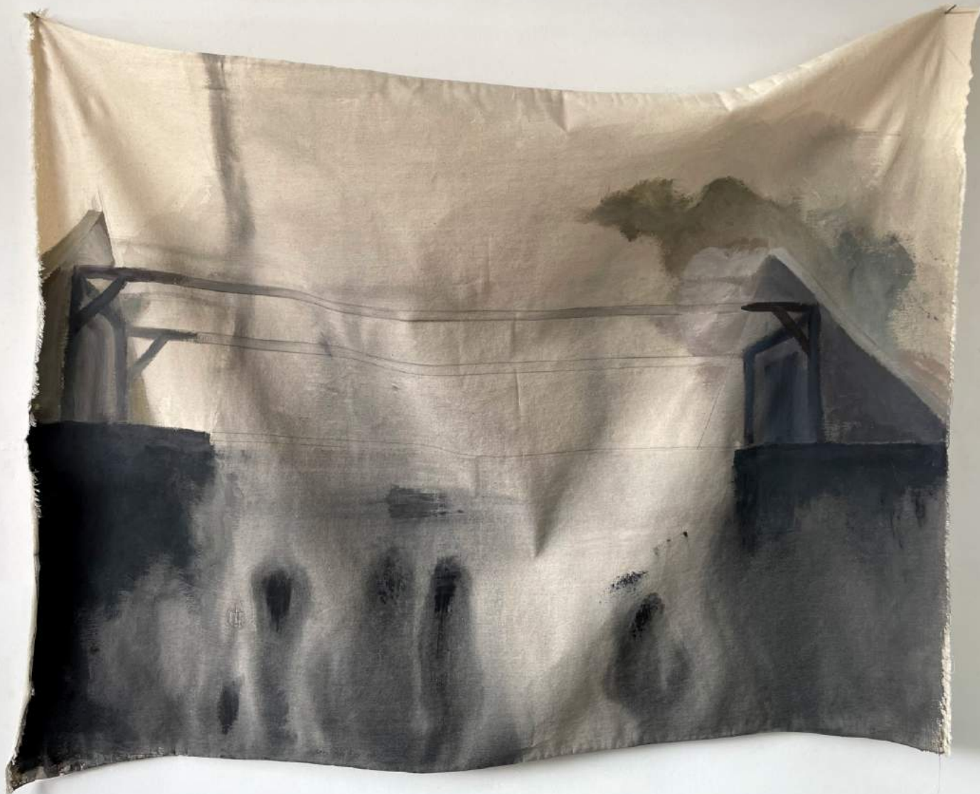
Monika Szczygieł, Dom / Home , akryl / acrylic, 2022